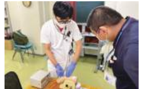
研修センターでの様子