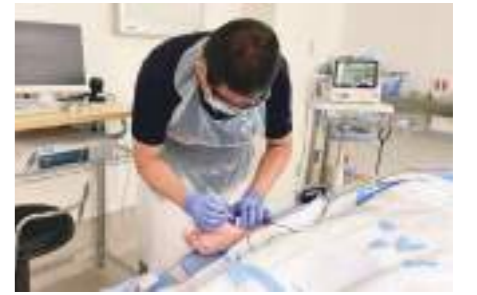
看護師による特定行為の様子

■ 特定行為研修 新古賀病院にある特定行為研修センターで働きながら受講していただけます。また、期間限定で受講料を助成しています。