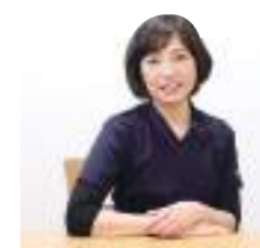
新古賀リハビリテーション病院みらい みらい介護医療院 看護部長

古賀病院21は急性期病棟に加え、回復期リハビリ・緩和ケア・HCUなど専門病床を備えており、地域密着で幅広い医療・看護を提供しています。整形外科や泌尿器科では最先端の手術からリハビリの提供も行い、がん診療では診断から緩和ケアまで総合的なサポート体制を整えています。個性を大切にして成長できるアットホームな環境で、看護師としてのキャリアをスタートさせませんか。