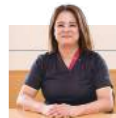
古賀病院21 看護部長

新古賀病院は、最新の医療設備・機器をもって救急を受け入れる地域の中隔病院として重要な役割を担っており、患者さまを中心に全人的に捉え・寄り添い、心温まるやさしい看護・介護の提供を目指しています。プリセプターシップを導入し、先輩看護師に技術面・精神面で支えてもらいながら成長できる環境のもと、患者さまとご家族に満足いただける看護を一緒に実践していきましょう。