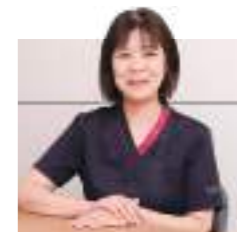
新古賀病院 看護部長

「人々の豊かな生涯を支援する医療・介護」という理念の下、住みなれた場所で病気と向き合い治療を行える環境を整え、常に患者さまの立場に立ち、安心して受診頂くことを目標にしています。予防から急性期、回復期、訪問看護、介護と多彩な領域で活躍いただくための人材育成や教育にも力を入れており、院内外での研修会への参加など、看護師としての成長をサポートします。